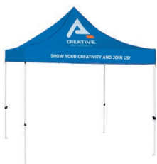
Stan se stříškou