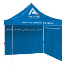
Stan se stříškou a kombinovanými stěnami