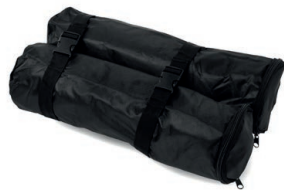
Zátěž na písek