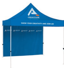
Stan se stříškou a celou stěnou