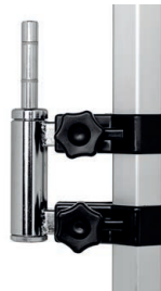
Set držáku na vlajku