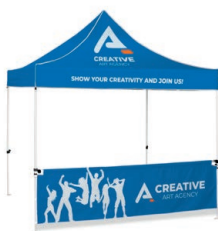
Stan se stříškou a poloviční stěnou