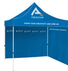
Zelt mit Canopy und mehreren Wänden