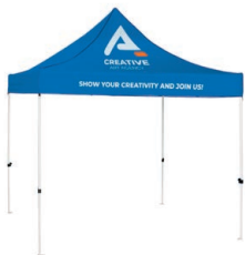
Zelt mit Canopy