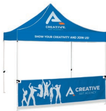
Zelt mit Canopy und Halbwand