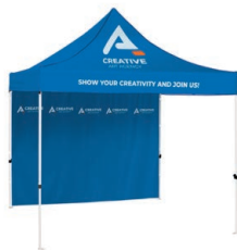
Zelt mit Canopy und Wand