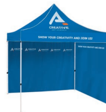
Tente avec auvent et parois multiples