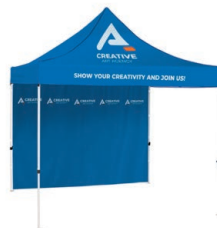
Tente avec auvent et paroi complète