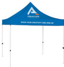
Tente avec auvent