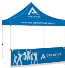
Tente avec auvent et demi paroi